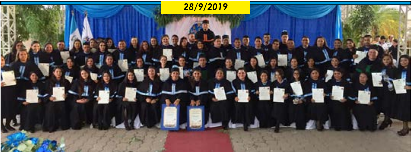
Carrera de Pedagogía de CUNORI graduó a 61 nuevos profesionales de la educación.