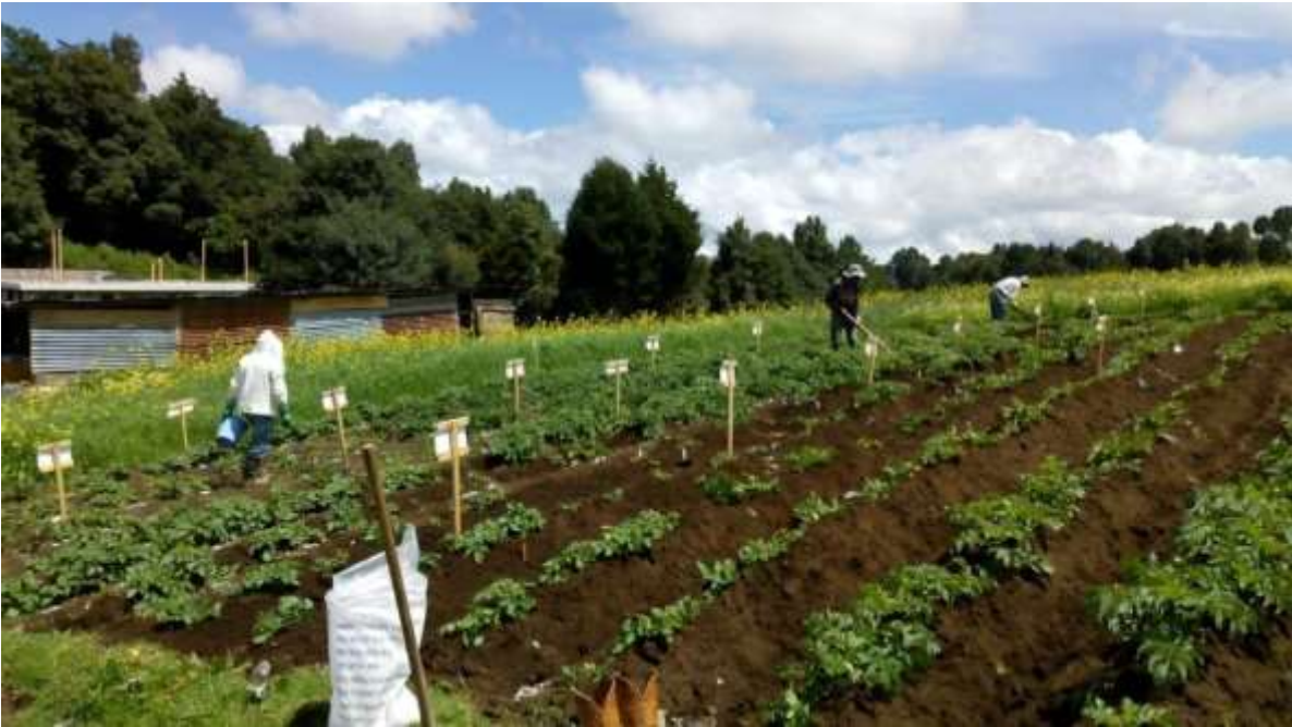
Figura 2. Manejo agronómico del ensayo en aldea Los Laureles Palestina de los Altos, Quetzaltenango