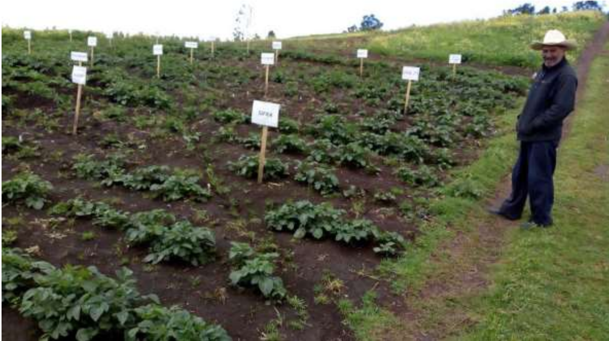
Figura 1. Ensayo de rendimiento y resistencia de cultivares de papa a la infección del nematodo dorado en aldea Los Laureles Palestina de los Altos, Quetzaltenango