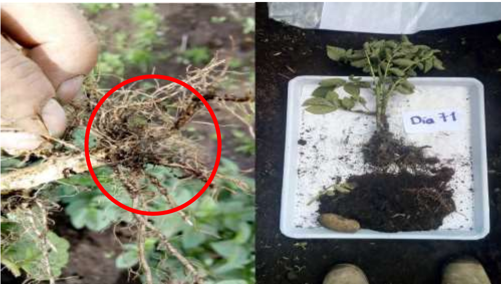
Figura 4. Conteo de quistes adheridos a las raíces