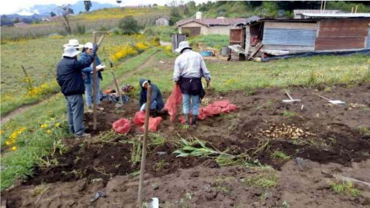
Figura 3. Cosecha de ensayo de rendimiento en aldea Los Laureles Palestina de los Altos, Quetzaltenango.