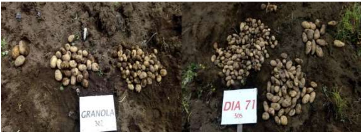
Figura 9. Variedades evaluadas Granola y Dia 71