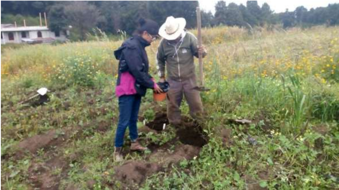
Figura 5. Toma de muestras en aldea Los Laureles Palestina de los Altos, Quetzaltenango