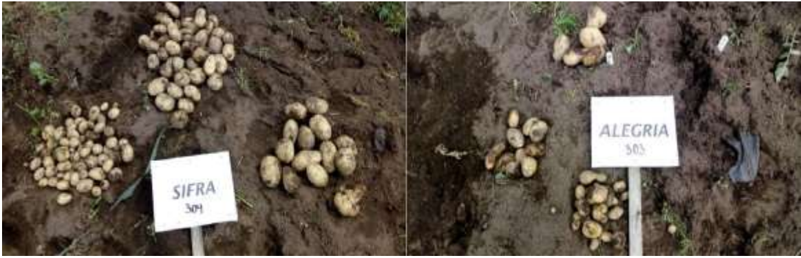
Figura 7. Variedades evaluadas Sifra y alegría