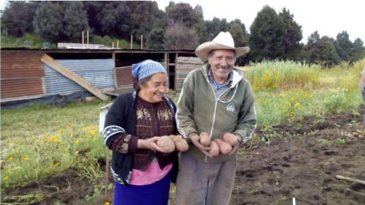
Figura 10. Productores de papa de la aldea Los Laureles Palestina de los Altos Quetzaltenango.