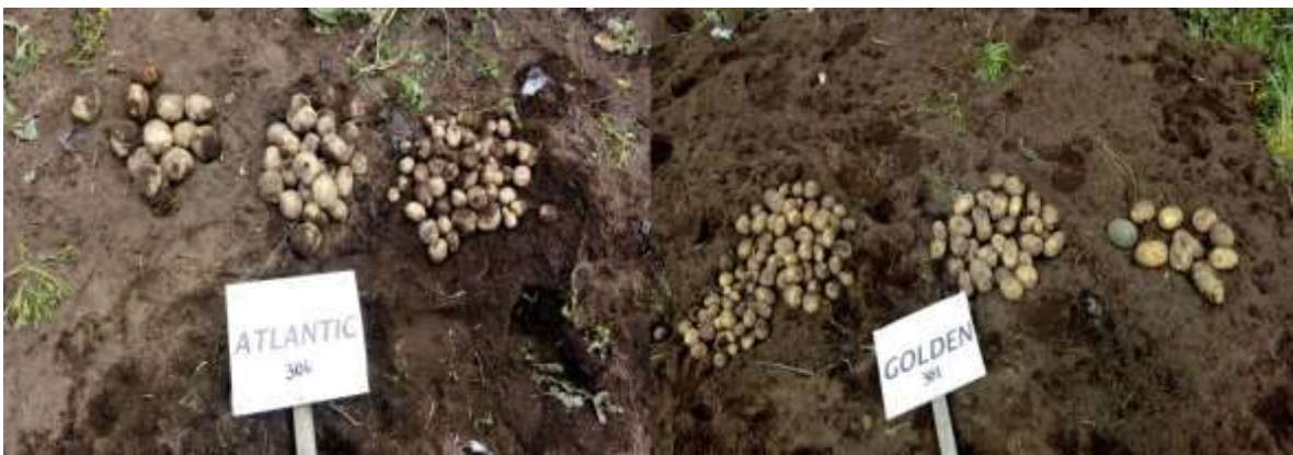
Figura 8. Variedades evaluadas Atlantic y Golden Globe